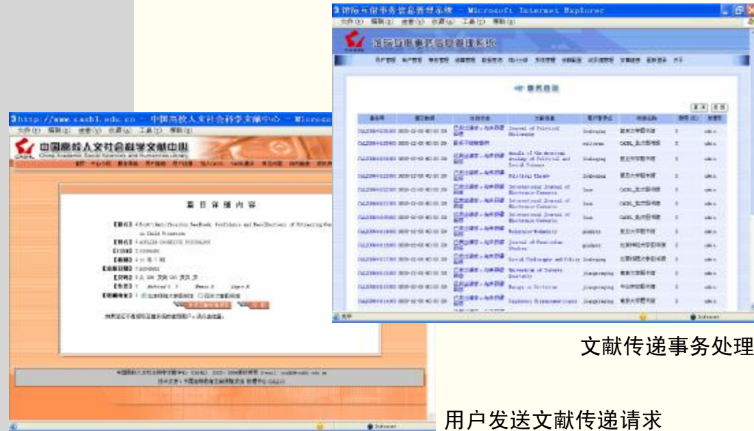
文献传递事务处理