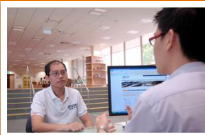
科学图书馆 Science Library